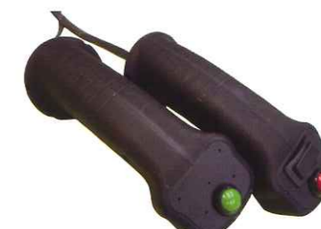
ジョイスティック