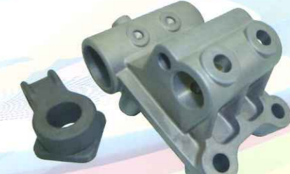
アルミダイキャスト