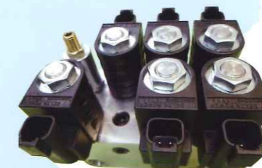
ソレノイドバルブ